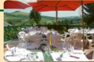
Geburtstage, Familienfeste, ...

Unsere Überzeugung: Was denkbar ist, ist auch machbar!