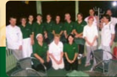
unser Team freut sich, Sie verwöhnen zu dürfen!