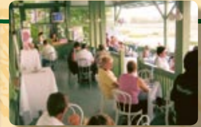
auf der Trabrennbahn in Baden